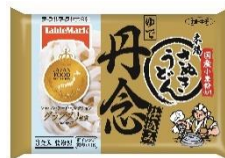
丹念仕込み 本場さぬきうどん 3食