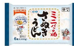
ミニパック さぬきうどん 6食