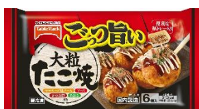
ごっつ旨い 大粒たこ焼