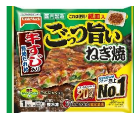
ごっつ旨い ねぎ焼