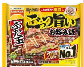
ごっつ旨い お好み焼ぶた玉