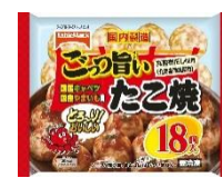
ごっつ旨い たこ焼 18 個