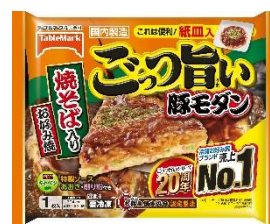
ごっつ旨い 豚モダン