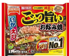
ごっつ旨い お好み焼