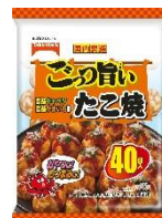
ごっつ旨い たこ焼 40 個