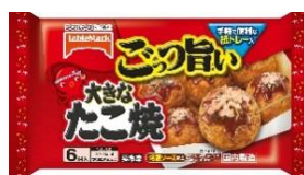
ごっつ旨い 大きなたこ焼