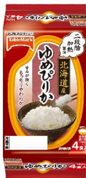
北海道産ゆめぴりか (分割)4食