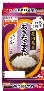
秋田県産あきたこまち (分割)4食