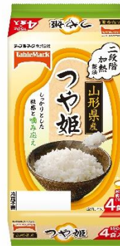
山形県産つや姫 (分割)4食