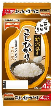
新潟県産こしひかり (分割)4食