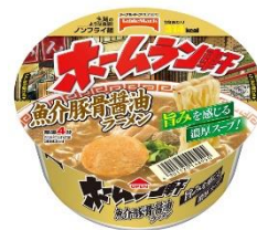
ホームラン軒 魚介豚骨醤油ラーメン

コシのある生麺のような食感のノンフライ麺でおなじみのホームラン軒シリーズに、このたび新商品として「ホームラン軒魚介豚骨醤油ラーメン」を追加します。醤油をベースにかつお節を使用して魚介の風味とポークの旨みを際立たせました。ホワイトペッパーのアクセントによってメリハリをつけたスープが特長です。