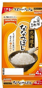
北海道産ななつぼし (分割)4食