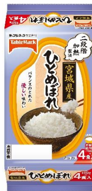
宮城県産ひとめぼれ(分割)4食

銘柄米シリーズは全部で6銘柄を取り揃えております。食べたことのない銘柄米にチャレンジする時などにも使っていただきたい商品です。