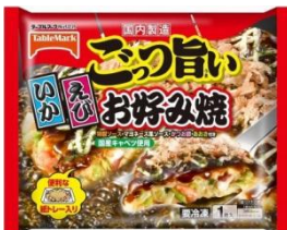
商品パッケージ表