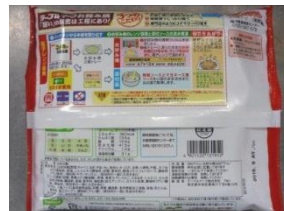
商品パッケージ裏