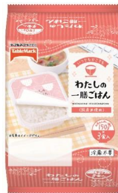
わたしの一膳ごはん 3食

また、お客様の日常に溶け込み、普段使いをしたくなるような可愛い7種類のフタのデザインを展開することで、働く女性のランチタイムの楽しみを提供します。