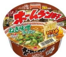
ホームラン軒ねぎ味噌ラーメン

テーブルマークは、「一番大切な人に食べてもらいたい」という想いのもと、付加価値のある商品づくりを進めてまいります。