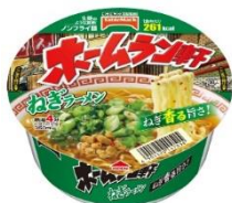
ホームラン軒ねぎラーメン

新商品「ホームラン軒ねぎ味噌ラーメン」は、2 種類の信州赤みそに、ローストネギオイルを加えた香ばしい風味のスープを味わえる商品です。アクセントに豆板醤を加えているのでピリっとした辛さも楽しめます。