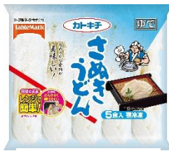
さぬきうどん 5食 (春夏パッケージ)

さぬきうどんの特徴は“強いコシ”“なめらかなのどごし”“もちもちとした食感”にあります。テーブルマークの冷凍「さぬきうどん」は原料だけでなく、製造工程にもこだわって本場の味わいを再現しています。うどんはたっぷりのお湯で釜揚げした直後に冷水でしめ、急速冷凍をしているため、打ちたて・ゆでたてのうどんの一番おいしい状態を保つことができます。調理方法は、鍋で約1分ゆでるか、電子レンジ(500W)で約3分30秒加熱するだけで本場さぬきうどんのようなコシや風味をいつでも簡単にお楽しみいただけます。