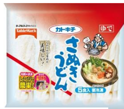
さぬきうどん 5食 (秋冬パッケージ)