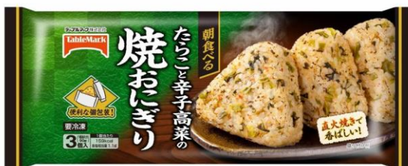
商品パッケージ表

商品名 : 朝食べる たらこと辛子高菜の焼おにぎり(90g×3個入) JANコード : 4 901520 127764 製造ロット : 賞味期限 2016. 10.7 製造工場 : 弊社 中央工場(香川県仲多度郡多度津町西港町8番地3) 販売期間 : 2015年10月10日(土)～同年11月4日(水) 販売数量 : 2,046 ケース(24,552 パック) ※不適切な表示となった商品については、少なくとも3パック販売 販売地域 : 全国 商品画像 :